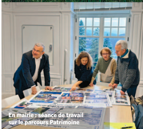
En mairie : séance de travail sur le parcours Patrimoine