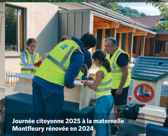
Journée citoyenne 2025 à la maternelle Montfleury rénovée en 2024

52 caméras de vidéoprotection fin d'installation février 2026.