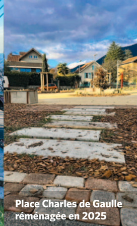
Place Charles de Gaulle réaménagée en 2025