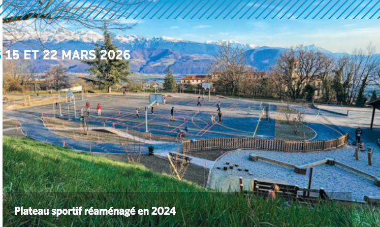
Plateau sportif réaménagé en 2024

25% de baisse de nos émissions de gaz à effet de serre. Source ALEC (12/2025).