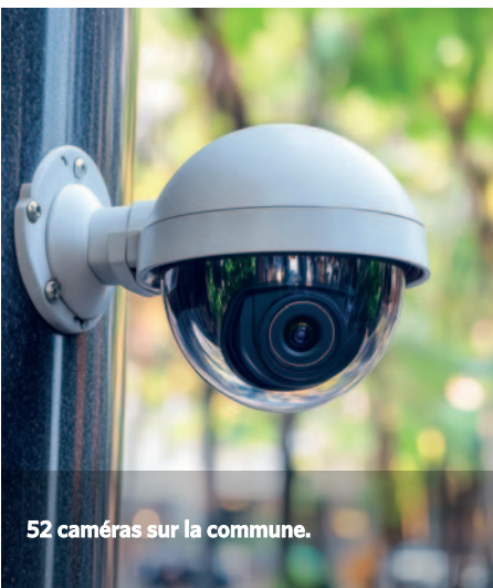
52 caméras sur la commune.