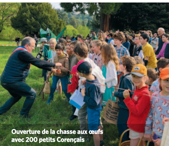
Ouverture de la chasse aux œufs avec 200 petits Corençais